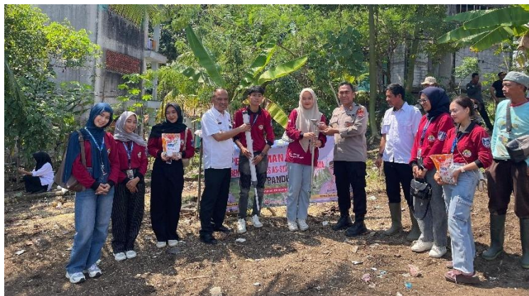
Gambar 3. Pengenalan Alat Tabur Pupuk kepada Masyarakat Kp.Cikadu

Pelaksanaan program ini menunjukkan bahwa penerapan Teknologi Tepat Guna dengan memanfaatkan bahan bekas dapat menjadi solusi nyata untuk meningkatkan efisiensi kerja petani. Dari sisi ergonomi, alat tabur pupuk ini membantu petani bekerja dalam posisi tubuh yang lebih sehat, sehingga dapat mengurangi risiko gangguan muskuloskeletal. Selain itu, pemanfaatan limbah PVC mendukung prinsip ramah lingkungan dan mengurangi biaya pembuatan alat.